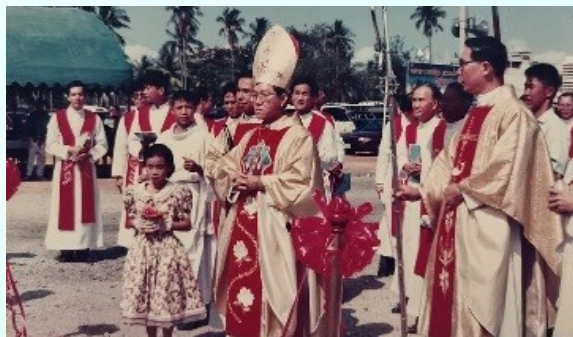
เปิดงานฉลอง 25 ปีกลุ่มคริสตชนวัดแม่พระเมืองลูร์ด บางแสน 9 กุมภาพันธ์ ค.ศ. 1992