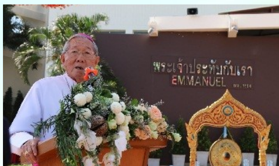
เปิดงานฉลอง 50 ปีกลุ่มคริสตชนวัดแม่พระเมืองลูร์ด บางแสน 12 กุมภาพันธ์ ค.ศ. 2017